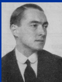
Richard Nikolaus de Coudenhove-Kalergi

« L'Europe s'est forgée sur les valeurs constitutives et complémentaires d'Athènes et de Rome. Au cours de millénaires successifs, les meilleurs comme les pires du genre humain ont tenté de s'emparer de son espace par des conquêtes éphémères.